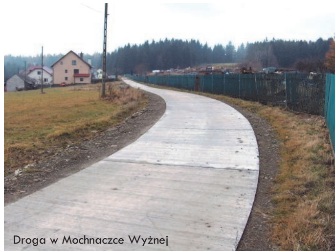
Droga w Mochnaczce Wyżnej