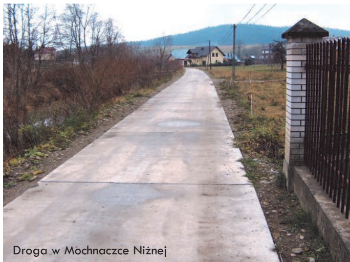
Droga w Mochnaczce Niżnej

W wyniku inwestycji przeprowadzonych w ciągu ostatnich kilku miesięcy, na terenie sołectw przybyło łącznie kilkaset metrów bieżących nowej utwardzonej nawierzchni dróg gminnych. Zadania wykonane zostały w miejscowościach Mochnaczka Wyżna, Mochnaczka Niżna, Berest i Polany.