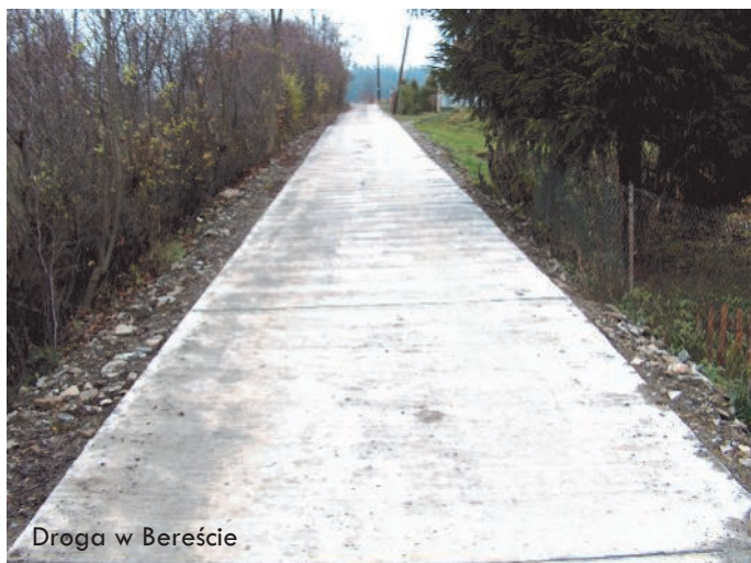
Droga w Bereście