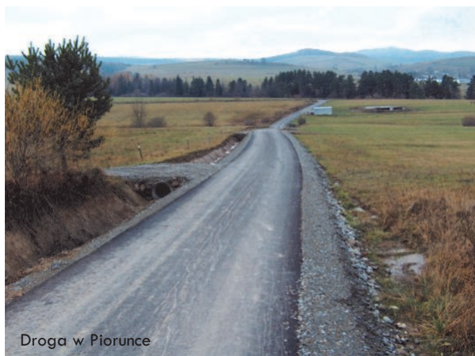
Droga w Pioruncie