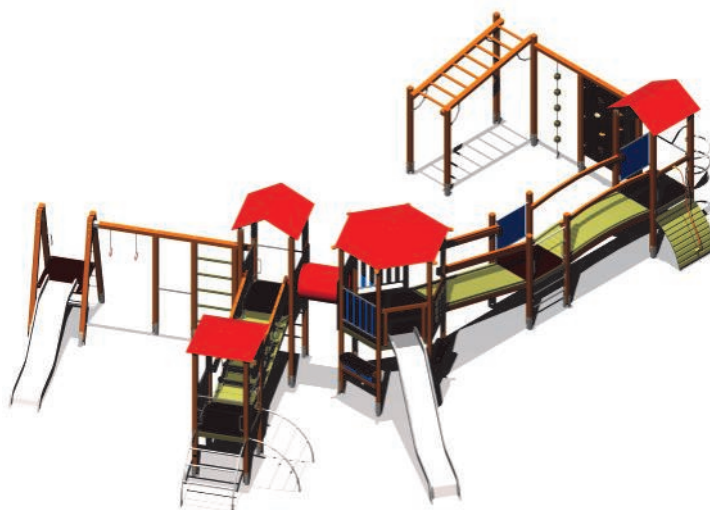
Przykładowy zestaw zabawowy