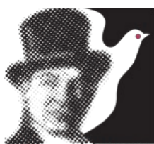
47 FESTIWAL IM. JANA KIEPURY