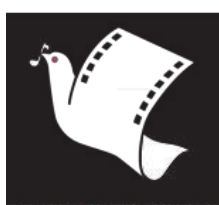
FESTIWAL FILMÓW MUZYCZNYCH