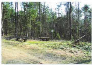
Źródełko wody mineralnej KRYNICA ZDRÓJ KWAŚNA 5 "POD SZALONE"