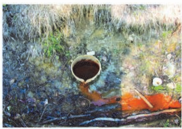
Źródełko wody mineralnej KRYNICA ZDRÓJ KWAŚNA 4 "WIADERKO"