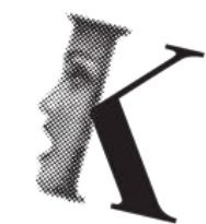
KIEPURIADA – FESTIWAL MŁODYCH