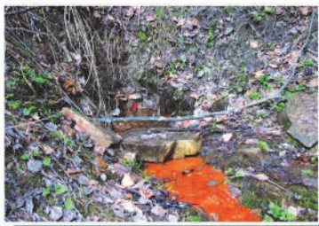
Źródełko wody mineralnej KRYNICA ZDRÓJ KWAŚNA 3