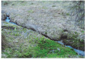
Źródełko wody mineralnej KRYNICA ZDRÓJ KWAŚNA 1 "KOŁO ŹRÓDLANEGO POTOKU"