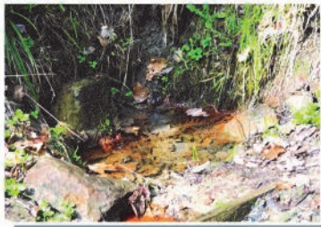
Źródełko wody mineralnej KRYNICA ZDRÓJ KWAŚNA 2 "GEOLOGÓW"