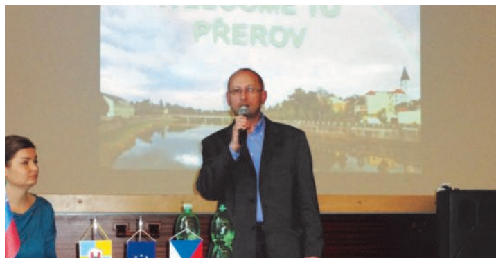
Inauguracja międzynarodowych warsztatów

W dniach 26 – 28 lutego 2014 r. w czeskim mieście Prerov odbyły się warsztaty w ramach projektu „From Active Citizenship To EuroCitizenship” („Od aktywnego obywatelstwa do euro obywatelstwa”). Krynica-Zdrój reprezentowali: słuchacze Krynickiego Uniwersytetu Otwartego, Biblioteka Publiczna oraz Stowarzyszenie Aktywną Bądź. Tematem warsztatów była działalność miast uczestniczących w projekcie na rzecz osób starszych.