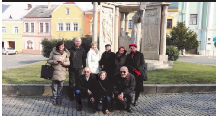
Zwiedzanie miasta Prerov