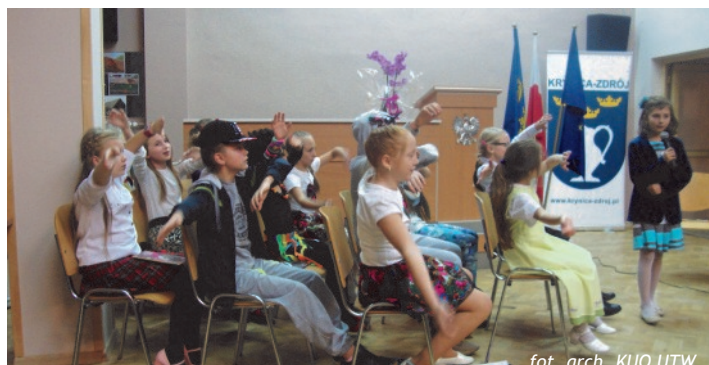
Występ – Kolo Teatralne „Centrum Berest”