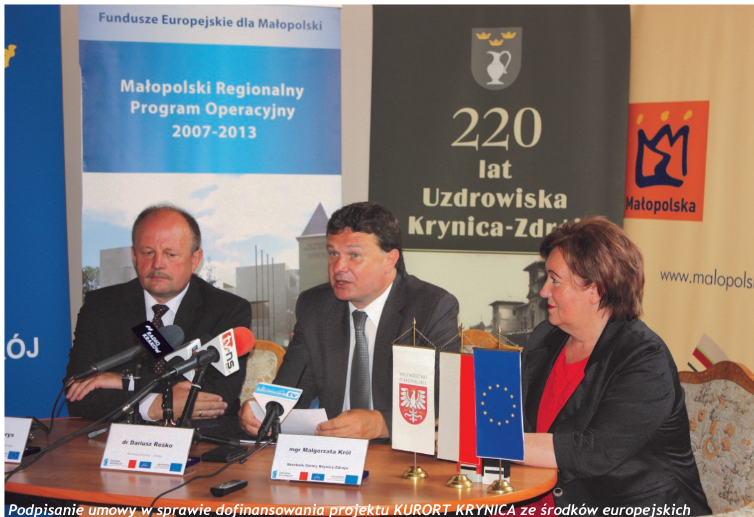
Podpisanie umowy w sprawie dofinansowania projektu KURORT KRYNICA ze środków europejskich