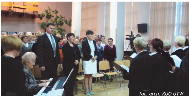
GAUDEAMUS IGITUR – Zespół Wokalny „Krynicy Seniorzy”