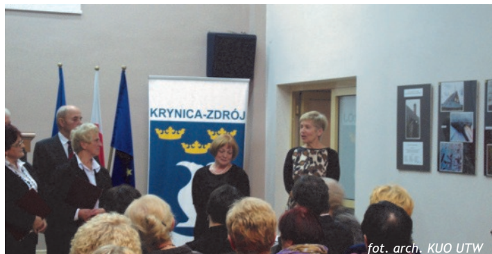
Powitanie Słuchaczy i Gości