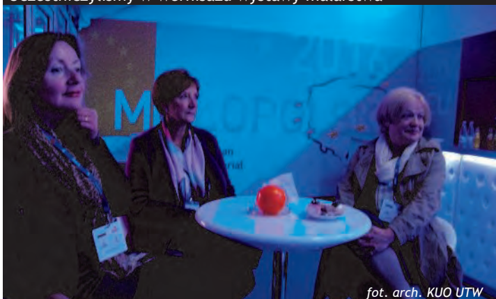
Gościliśmy na Forum Ekonomicznym