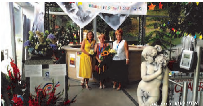
Działaliśmy w Prasowym Biurze Festiwalowym