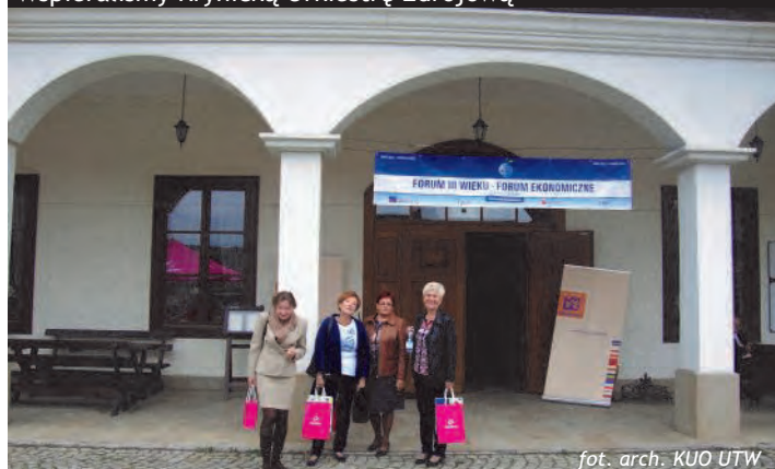
Gościliśmy na Forum III Wieku