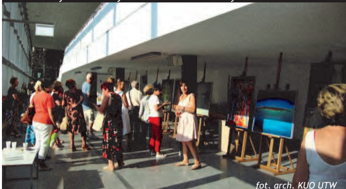
Uczestniczyliśmy w wernisażu wystawy malarstwa