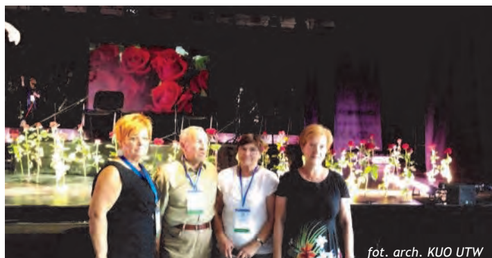
Tworzyliśmy Kwiatowe dekoracje sceniczne