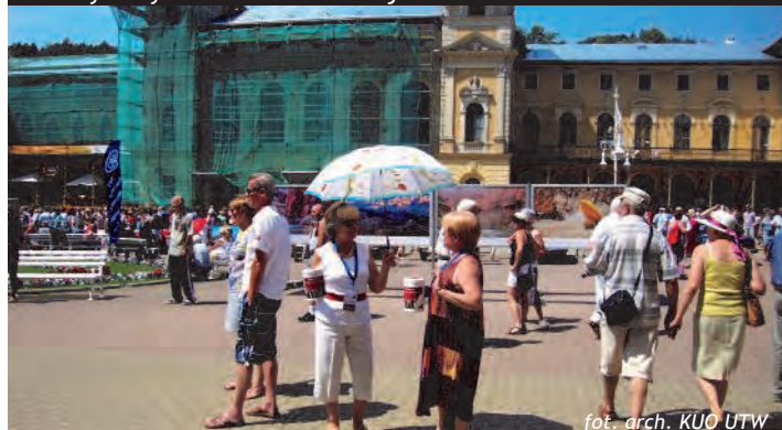
Wspieraliśmy Krynicką Orkiestrę Zdrojową