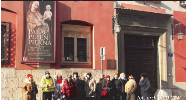
Przed Pałacem Biskupa E. Ciołka w Krakowie