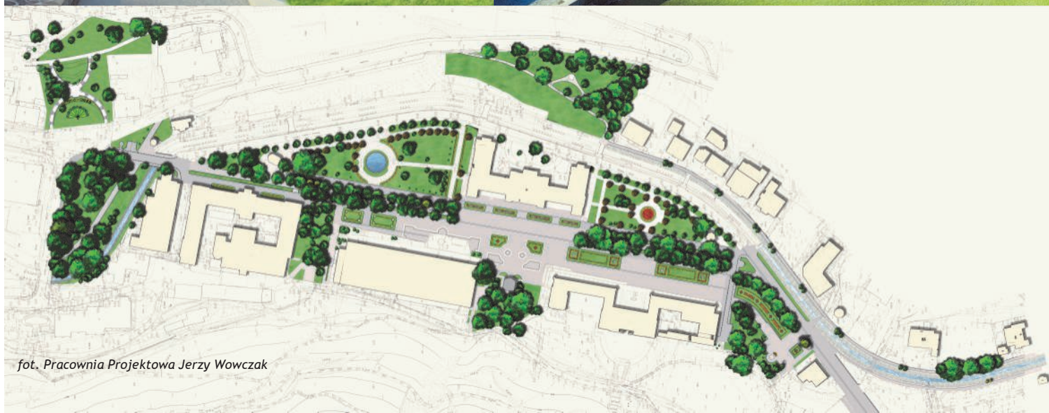
fot. Pracownia Projektowa Jerzy Wowczak