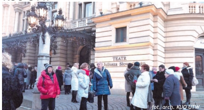
Przed spektaklem teatralnym w Krakowie