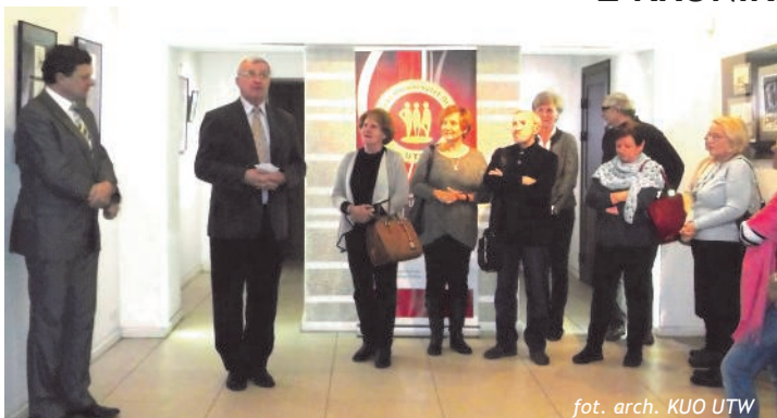
Na werniszażu prac Słuchaczy UTW w CK