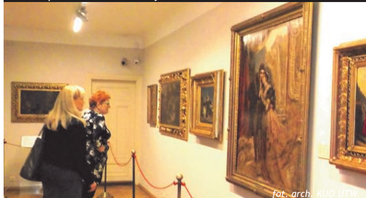
W domu Matejki w Krakowie