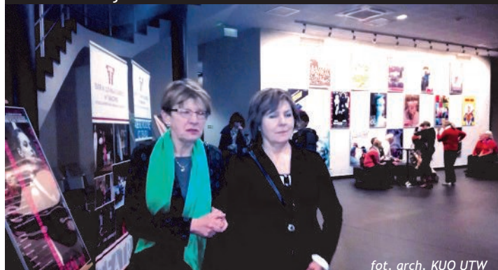
W Teatrze im. L. Solskiego w Tarnowie